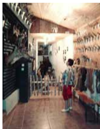
Ta medved je prava mrcina