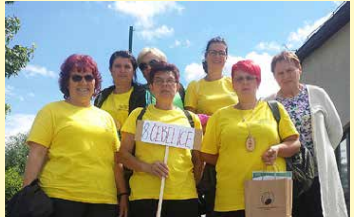
Tekmovalke z navijačicami

Za vse to sta bili na razpolago dve minuti. V naslednji igri smo sestavljale zloženke, na katerih je bil fotokopiran čebelnjak. To je bilo zelo zapleteno, saj so si bile barve zelo podobne in tudi panji so bili enaki. Tretja igra je bila dopolnjevanje Pavčkove pesmi. V četrti igri