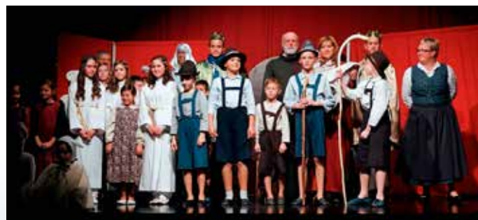
Nastopajoči v Božični zgodbi

Kako zelo si otroci želijo nastopati, pove dejstvo, da so že takoj po predstavi pričeli spraševati, če bodo naslednje leto spet lahko nastopali. Seveda bodo lahko, potrudili se bomo, da bomo ustvarili novo zgodbo, primerno za ta čas. Skušali se bomo prilagajati učencem, tako