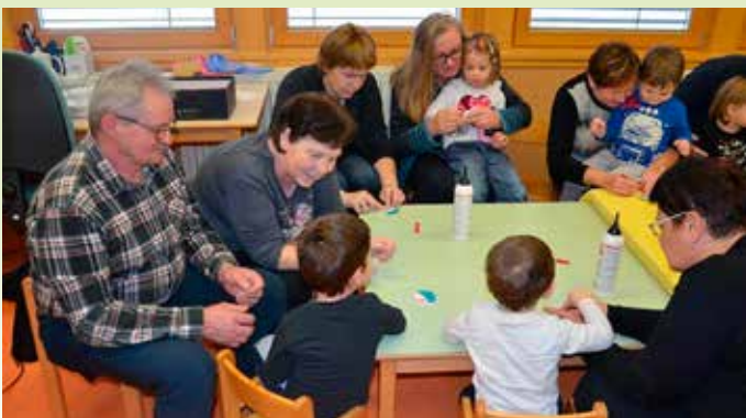
Druženje z babicami in dedki