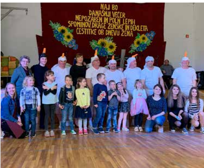
Natopajoči v kulturnem programu