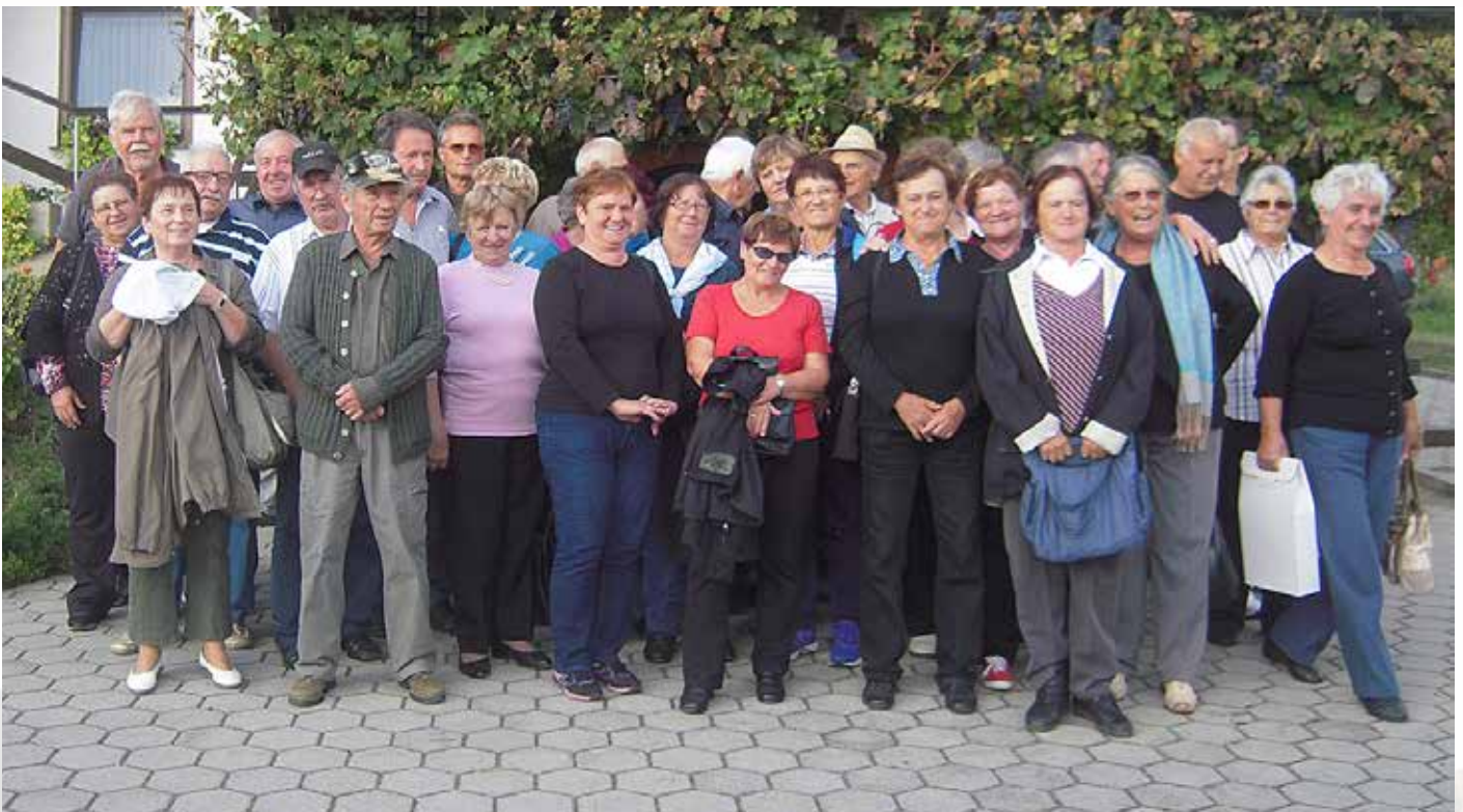
Člani Društva upokoencev Ribnica na Pohorju