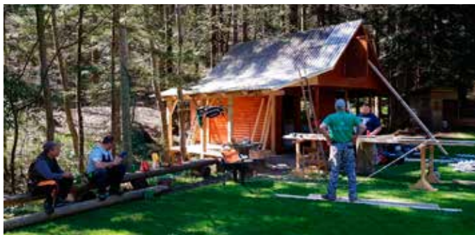
Delovna akcija travnato igrišče april 2018

Lani oz. že kakšno leto poprej je od naših članov prišla pobuda, da bi lahko ŠD organiziralo kakšen pohod. Zamisel je obrodila sadove, saj smo prvi takšen pohod organizirali na praznik velike noči, in sicer na velikonočni ponedeljek. Pohod je potekal od našega vaškega doma do domačije »Prapertnik« in nato vse do Pesnika, kjer sta nas pričakala topla malica in nekaj osvežilne pijače, da smo se lahko okrepčani vrnili nazaj. Pohoda se je udeležilo preko 35 pohodnikov, ki smo v en glas zatrdili, da mora ta pohod postati tradicionalen.