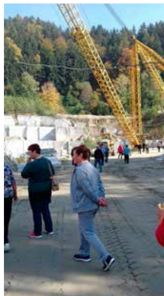
Ogled kamnoloma v Cezlaku

Že drugo leto smo v Ribnici na Pohorju kuhali »Jernejevo župo«, saj nas je Turistično društvo Ribnica na Pohorju znova povabilo na