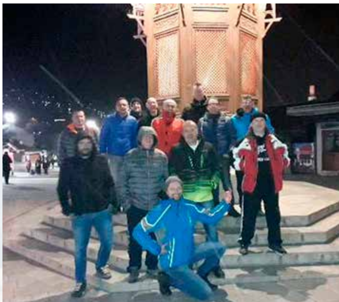
Del ekipe v Baščaršiji

Izlet ni prinesel zgolj zabave in malce nogometa. Z bosanskimi gostitelji so spletili lepe nogometne in prijateljske vezi ter se dogovorili za ponovno snidenje – morda pri nas v našem lepem kraju ali pa ponovno na pripravah v Bosni.