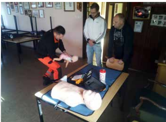
Izobraževanje iz temeljnih postopkov oživljanja

Skupno je na intervencijah sodelovalo 174 gasilk in gasilcev, opravljenih je bilo 950 prostovoljnih delovnih ur. Pri vseh intervencijah je najbolj pomembno, da so se zaključile brez poškodb gasilk in gasilcev.