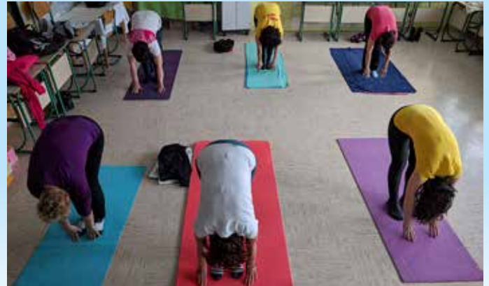
Del skupine med vadbo