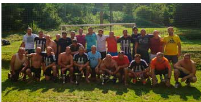
Veteranski turnir Hudi Kot – avgust 2018

se je delovnih akcij v letošnjem letu udeležilo skorajda tri četrt vseh članov ŠD.