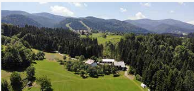
Kmetija tete Lene

snovali skupaj s podjetjem RBS turizem d.o.o. in se imenuje Black Peak (Črni Vrh), boste v kratkem lahko spremljali tudi na spletni strani. Ponudba zajema oddajo koles skupaj z nastanitvijo, vodenjem in ostalimi storitvami. Kolesa bomo kot dodatno ponudbo oddajali našim gostom in vsem, ki se bodo v kolesarjenju z električnim kolesom želeli preizkusiti. Gostje bodo spoznavali in odkrivali tudi okolico in skrite bisere našega prekrasnega Pohorja. Potovanje s temi kolesi bo pogled z bližnjih hribov še polepšal.