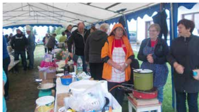
Jernejeva župa v Ribnici

tradicionalno prireditev. Tudi na treninge in na tekmovanja v pikadu nismo pozabili. Organizirali smo turnir ob občinskem prazniku, ženska ekipa pa se je udeležila Koroške pikado lige.