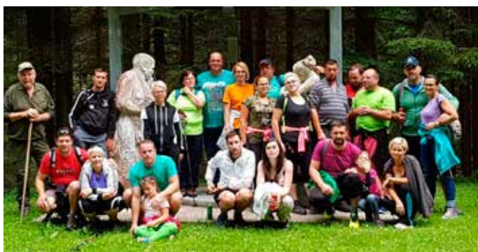
Drugi pohod za člane in članice, ter simpatizerje ŠD HUDI KOT - julij 2018