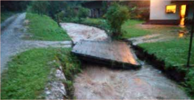
Ob neurju je vodotok uničil most