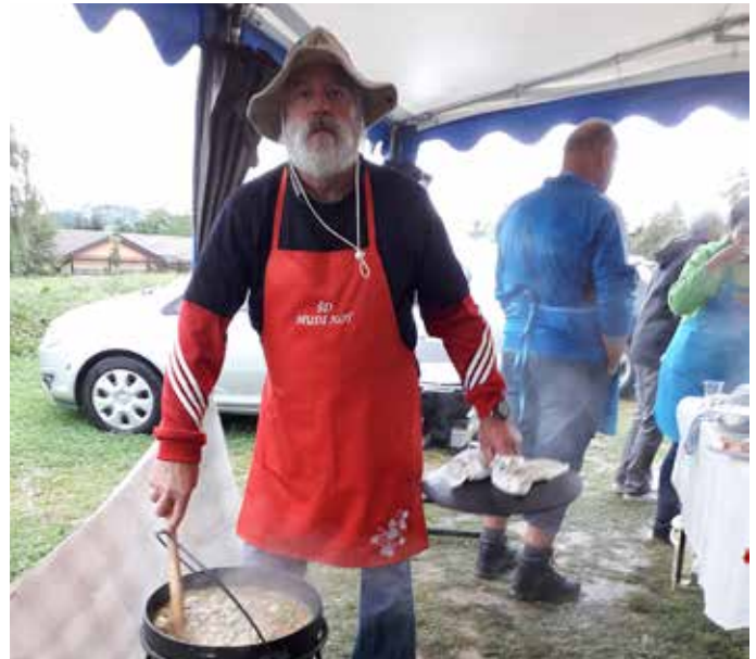
Kuhanje »Jernejeve župe« avgust 2018

Z velikim veseljem lahko povem, da smo poleg vseh zgoraj omenjenih prireditev in dejavnosti organizirali 18 delovnih akcij, na katerih smo opravili 629 delovnih ur. V veliko zadovoljstvo mi je tudi to, da