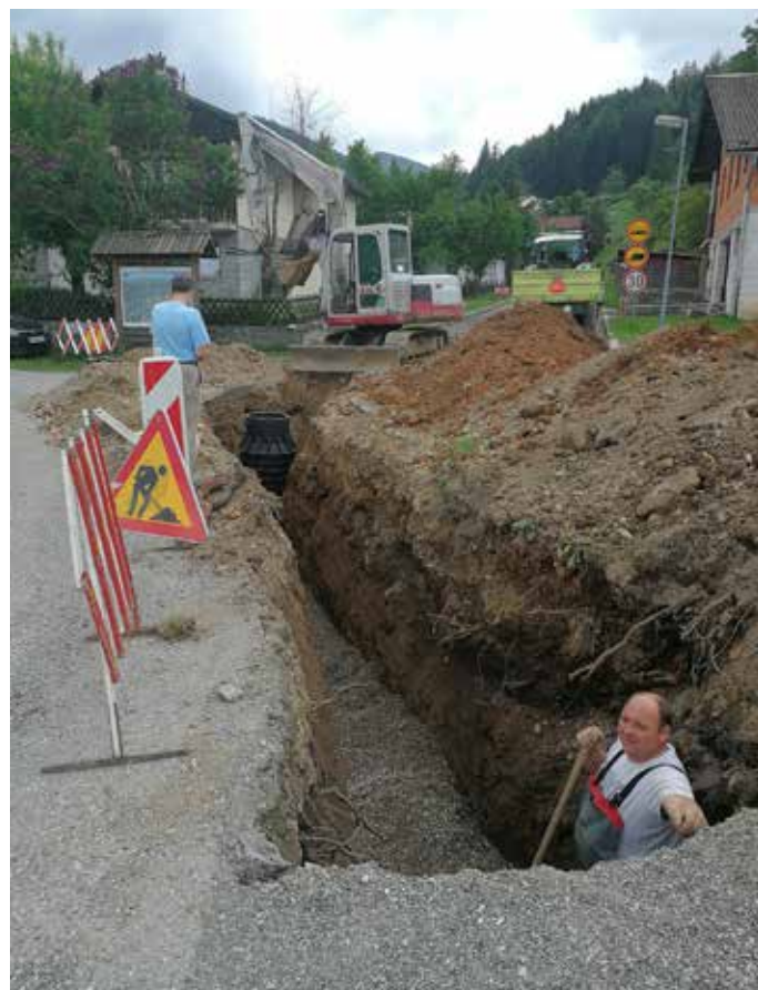
Narejena je že tretjina kanalizacijskih vodov v Josipdolu

Varovanje okolja je obveza vseh nas za prihodnje rodove. Zato tudi gradimo čistilne naprave, izboljšujemo stanje okolja, sofinanciramo nakup malih čistilnih naprav in podobno. Tem ukrepom smo v letu 2018 namenili slabih 199.000 evrov, največ seveda za izgradnjo fekalne kanalizacije Josipdol. Tudi ravnanje z odpadki je pomembna tema, ki ji z JKP Radlje ob Dravi posvečamo izredno pozornost. Zavedamo se, da so računi na položnicah precej visoki, zato jih tudi subvencioniramo v dovoljenih okvirih. Pa vendar moramo še nadalje osveščati ljudi, predvsem mlade, da lahko s temeljitim ločevanjem odpadkov pomembno vplivamo na višino računov.