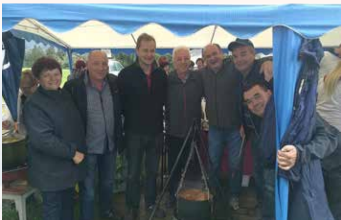
Kuhanje Jernejeve župe, 26. 8. 2018

V jeseni smo pripravili srečanje okoliških pevskega zborov pod naslovom »Sosed, dober dan«. Gostovali smo zbere iz sosednjih kra-