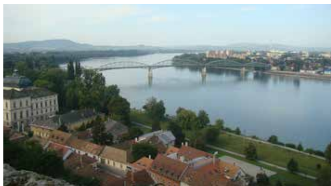
Pogled z grajskega hriba