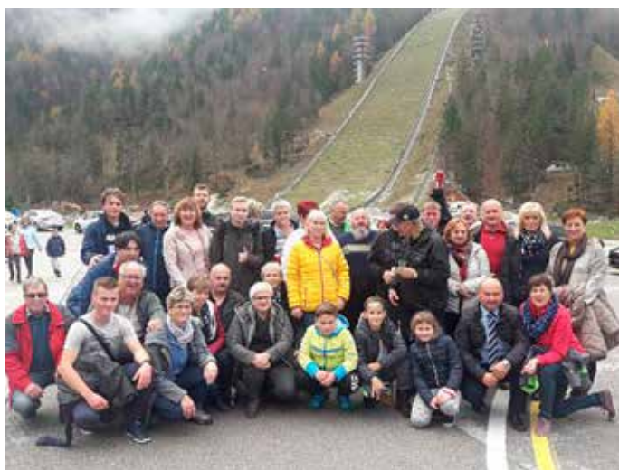
Pod planiško velikanko