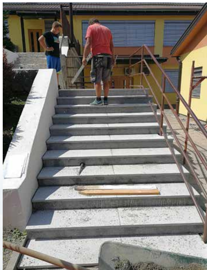
Osnovna šola je dobila novo stopnišče