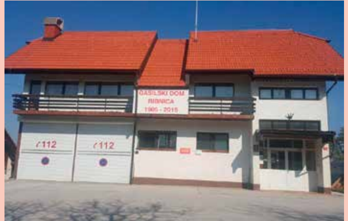
Nova streha na gasilskem domu

Zoll s pomočjo klasičnega defibrilatorja izvedel prvo zunanjo defibrilacijo pri človeku. V začetku 70. let prejšnjega stoletja so že preizkušali prve modele avtomatskih defibrilatorjev, dejanske študije pa so pričeli leta 1980 z napravo, ki je tehtala skoraj 13 kg (danes nekateri tehtajo manj kot 2 kg). Prvo poročilo o uporabi samolepilnih elektrod so objavili maja leta 1986.