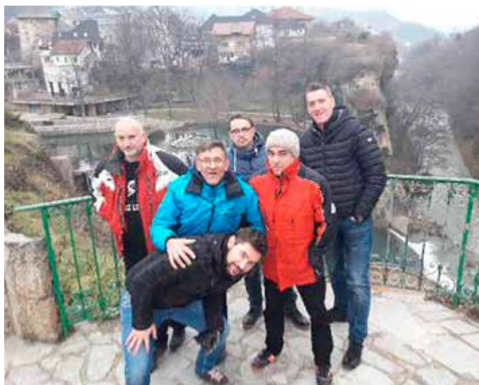
Raziskovanje okolice reke Miljacke

Tekma je minila v sproščenem vzdušju z veliko smeha in tudi veliko žog v mreži (predvsem josipdolskih veteranov). Prijazni gostitelji so po tekmi pripravili pravcato pojedino. Ker pa so prav vsi imeli še veliko energije, so gostitelji Josipdolčanom prijazno predstavili tudi nočno življenje v Banjaluki. Zabava je morda trajala celo nekoliko predolgo in kar nekaj potnikov je imelo naslednji dan težave z zgodnjo uro nadaljevanja poti proti Sarajevu. Pred povratkom domov so