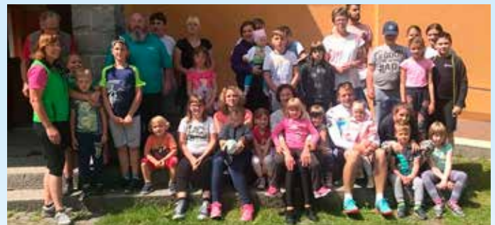
Udeleženci prireditve Pohorski Pepi išče zaklad