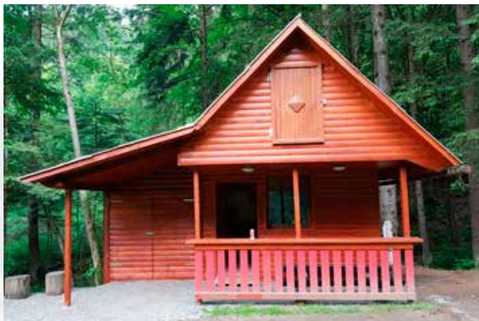
Nova pridobitev na veteranskem igrišču – nova »strojna lopa«

Kot je običajno, sta prva dva spomladanska meseca za naše športno društvo zelo delovna. Tako nam je na travnatem igrišču ob že obstoječi objekt le uspelo postaviti strojno lopo, izgradnjo katere smo načrtovali že dve leti. Na igrišču pa smo pred obema goloma ponovno posejali novo travno rušo.