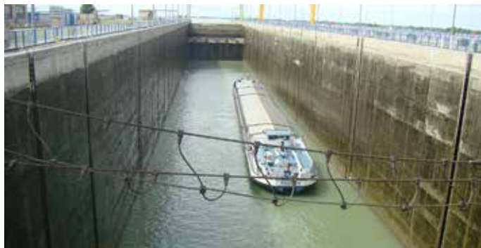
Dvigovanje rečne ladje