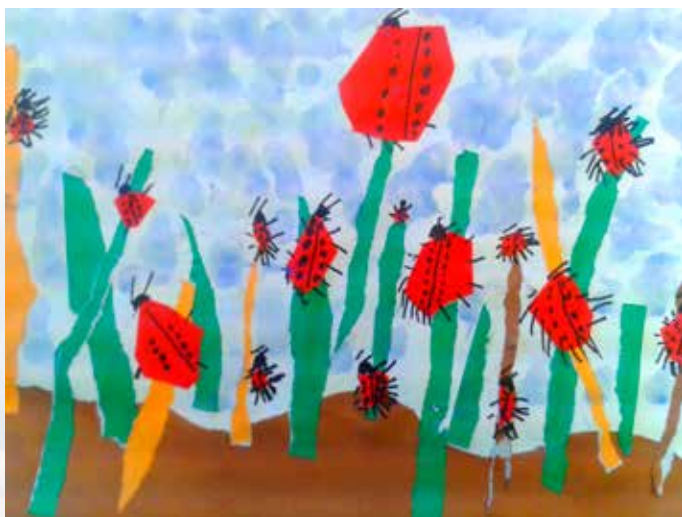
Pikapolonice, moje prijateljice