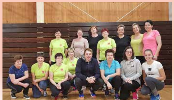
Del članic koronarne skupine Ribnica na Pohorju

Vedno se dogaja kaj novega in zanimivega. Moto našega druženja je, da ohranjamo zdrav duh v zdravem telesu.