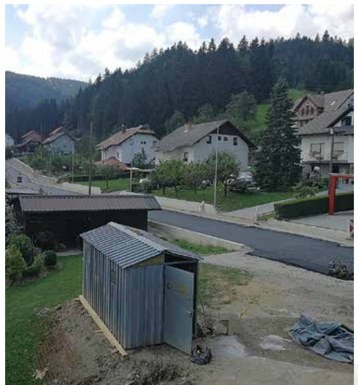
Državna cesta skozi Ribnico na Pohorju

V letu 2018 smo za vzdrževanje občinskih cest in javnih poti porabili slabih 169.000 evrov. V tej številki je tudi naš del financiranja rekonstrukcije državne ceste skozi Ribnico na Pohorju v višini 50.515 evrov (občina je za to cesto prispevala skupaj dobrih 130.000 evrov). Če sem prištel še vzdrževanje gozdnih cest v višini dobrih 52.000 evrov, ugotovimo, da smo za ceste porabili kar 221.000 evrov. V občinski upravi se zavedamo, da bi bilo potrebno na cestah še marsikaj storiti, nekatere tudi asfaltirati, a žal za to glede na druge naloge nimamo dovolj denarja. A vendar bomo tudi letos cestam posvečali posebno pozornost. Cesta na Janževski Vrh že nekaj let kliče po obnovi in menim, da nam bo letos uspelo.