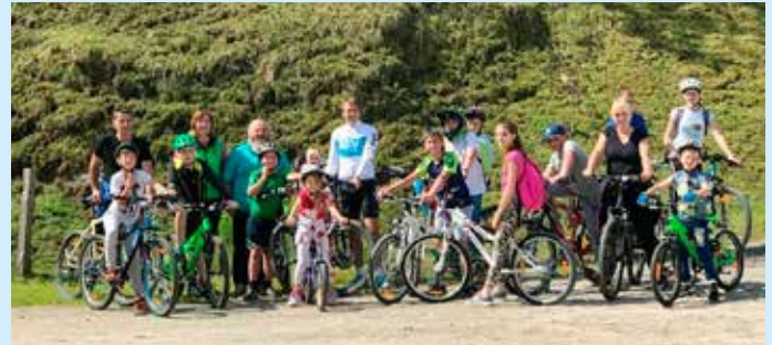
Kolesarjenje in iskanje Pepijevega zaklada

Prireditve ob občinskem prazniku smo popestrili s kolesarjenjem, tokrat za mlajšo generacijo. V sklopu kolesarjenja smo skupaj z društvom KET Josipdol organizirali iskanje Pepijevega zaklada. Otroci so bili navdušeni, pogumno so se podali na kolo in vsi so hoteli biti prvi pri „Bočnikovi ridi“. Pot jih je nato vodila do kulturne dvorane,