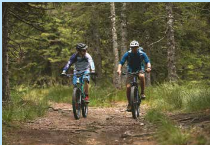
Raziskovanje lepot Pohorja z električnimi kolesi

Z načrtnim razvojem e-kolesarstva želimo turistom na dejaven, a vseeno prijeten način približati kulturne in naravne znamenitosti