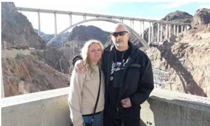
Božični ogled Hooverjevega jezua in kanjona reke Kolorado v bundi z napisom PRUHAR

zapomnil po tem, da sem si ogledal veliko svetovnih znamenitosti, za katere si v življenju nisem mislil, da si jih bom sploh kdaj ogledal v živo. Več o potovanju po ZDA in vseh znamenitostih lahko preberete in prekopirate z moje Facebook strani, kjer imam poleg obširnega potopisa tudi slike in video posnetke.