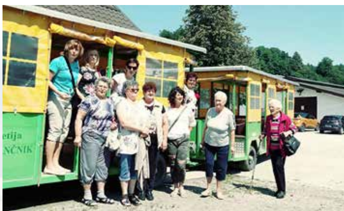
Pripravljene na vožnjo z vlakcem