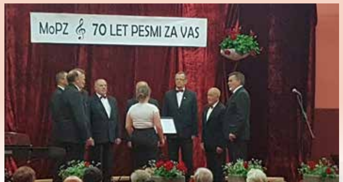
Nastop v Vuhredu ob 70. letnici Moškega zbora Vuhred, 26. 5. 2018