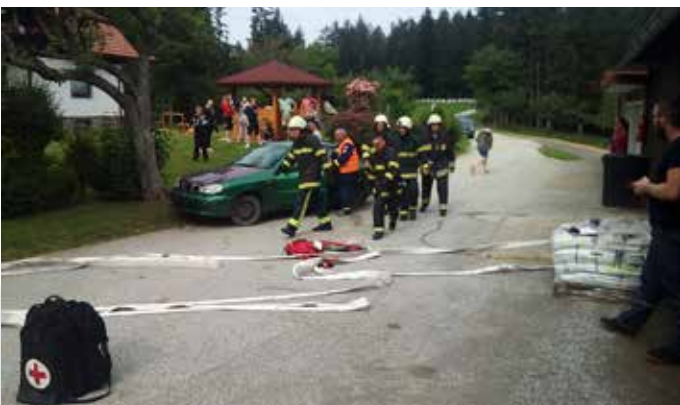
Vaja na Janževskem Vrhu