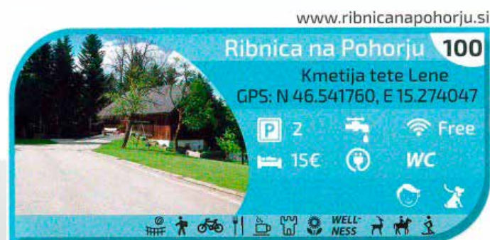
Pri teti Leni

leta 2017. Projekt »Mreža postajališč za avtodome po Sloveniji«, ki ga vodi Občina Mirna, je povezal 87 občin. K lokalnim skupnostim, ki si želijo postati prijazne za popotnike z avtodomi, sodi tudi Občina Ribnica na Pohorju, zato je leta 2017 pristopila k projektu, katerega namen je spodbujanje avtodomarskega turizma, skupna predstavitev mreže in vanjo vključenih občin ter enotno nastopanje na evropski turistični borzi.