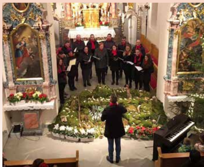
Nastop MePZ Rosika na Božičnem koncertu v Ribnici na Pohorju, 5. 1. 2019