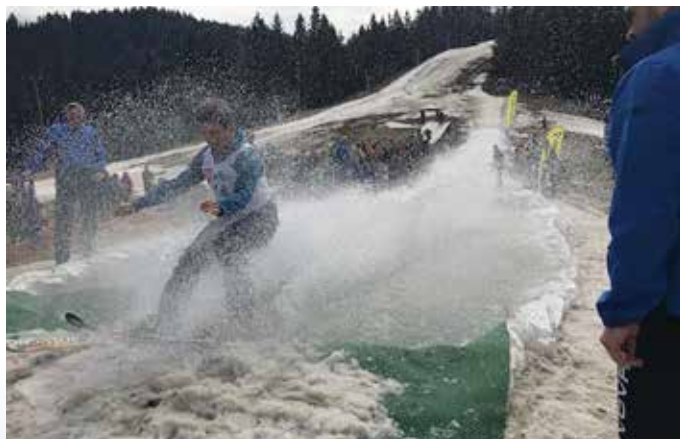
... če je uspelo prevoziti lužo, so bili mokri tudi gledalci