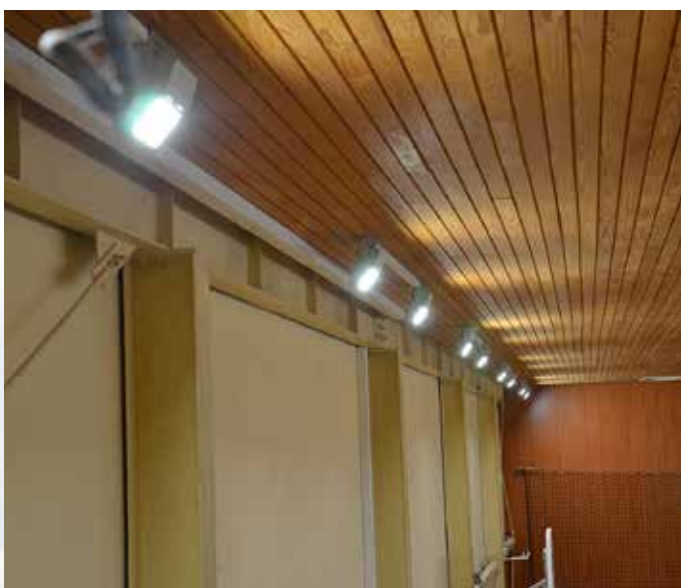
Sodobne luči v telovadnici prihranijo energijo in dajejo več svetlobe