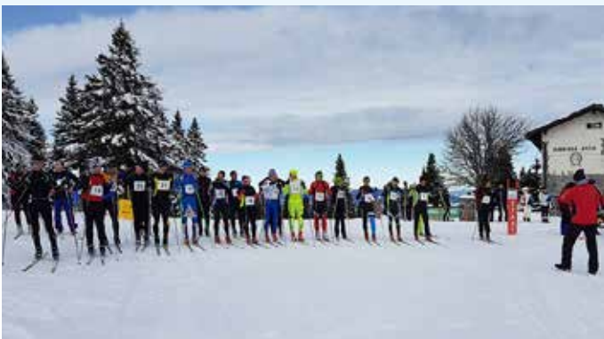
Smučarski tek Ribniške kočice