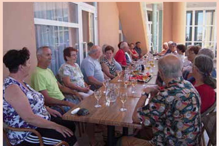
Druženje v hotelu »DELFIN«.