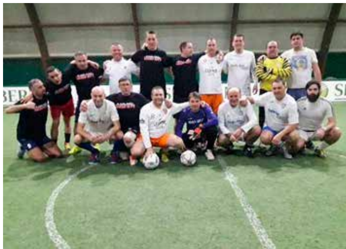
Skupinska fotografija z gostitelji

si ogledali še nekatere znamenitosti v centru Sarajeva, se sprehodili čez Baščaršijo in seveda spili tradicionalno bosansko kavo. Preizkusili so se tudi v nakupovanju in barantanju, da so ob povratku razveselili svoje drage. Sledila je dolga pot domov, kamor so prispeli s pomanjkanjem spanca, a neprecenljivimi spomini.