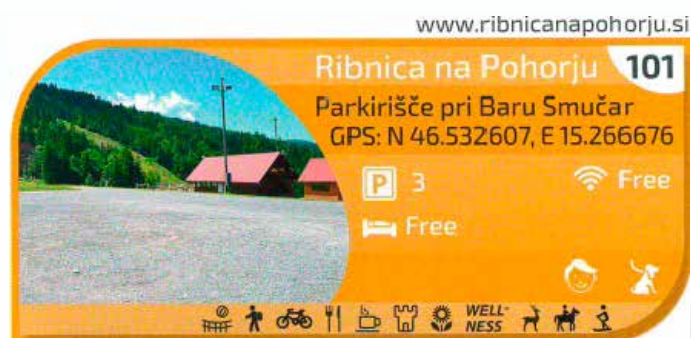
Pri baru Smučar

Več informacij je na voljo na spletni strani www.camperstop.si .