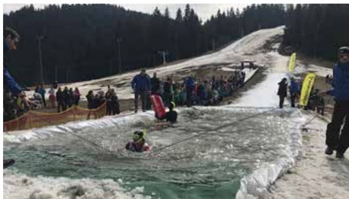
S potapljaško masko je bilo varneje