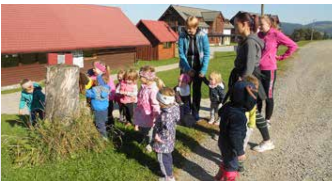
Predzadnja postaja-Vao, tek do velikega drevesa