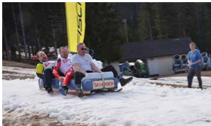
Ekipa Skihader v spustu in pričakovanju hladne kopeli