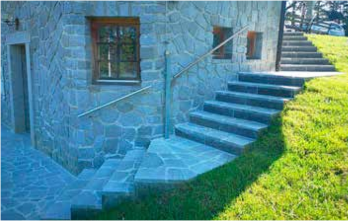
Poslovilna vežica in novo stopnišče do sanitarij

Tudi socialno varstvo in zdravstvo v zadnjem času bogato posegata v občinski proračun. Kar 123.000 evrov smo namenili zdravstvenemu zavarovanju brezposelnih oseb, zavodskim oskrbninam, subencioniranju najemnin občanom, Rdečemu križu in Karitasu. Ob vsem tem se iskreno zahvaljujem vsem, ki s svojim prostovoljnim delom ranljivim skupinam naših občanek in občanov vsaj nekoliko olajšajo vsakodnevne stiske.