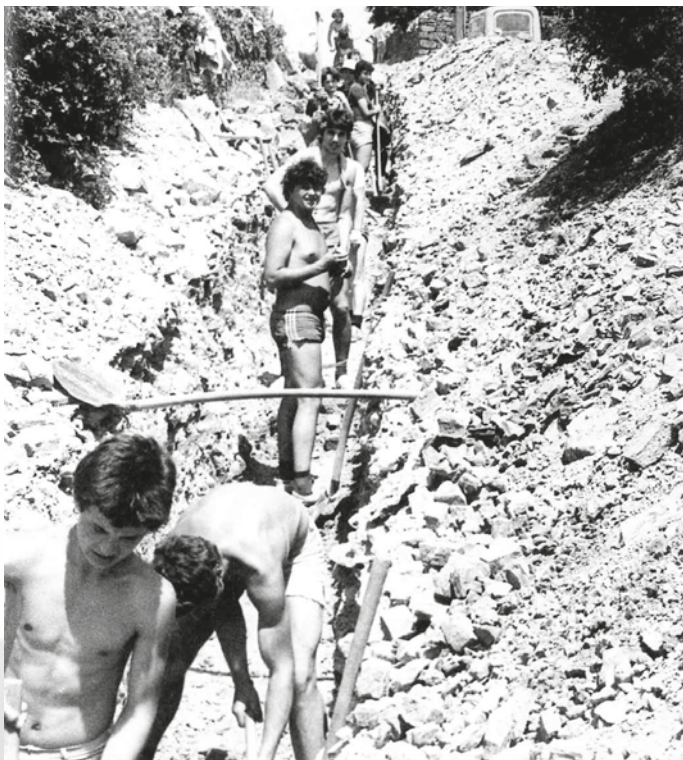
Brigadirji kopljejo traso za vodovod