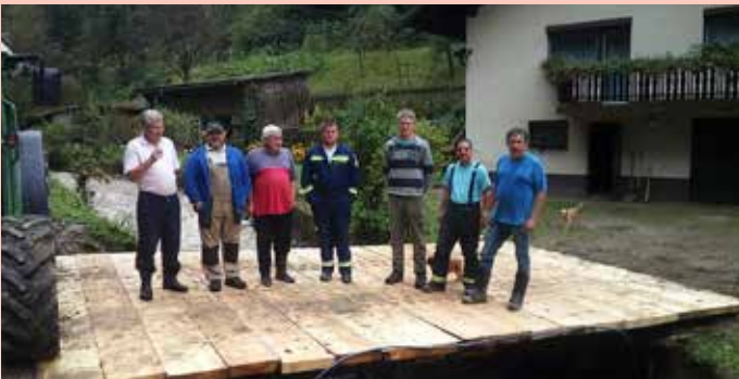
Nov most v Orlici

Na področju Občine Ribnica na Pohorju je nameščenih in javno dostopnih sedem avtomatskih eksternih defibrilatorjev ali AED. Da bi jih občani uporabili ob morebitni potrebi, smo gasilci že organizirali tečaje o uporabi AED in to prakso bomo nadaljevali še naprej, saj je pri zastoju srca pomemben čimprejšnji pristop in začetek temeljnega postopka oživljanja. Zato je potrebno osveščati krajane, da sosed sosedu, prijatelj prijatelju, sorodnik sorodniku lahko reši življenje.