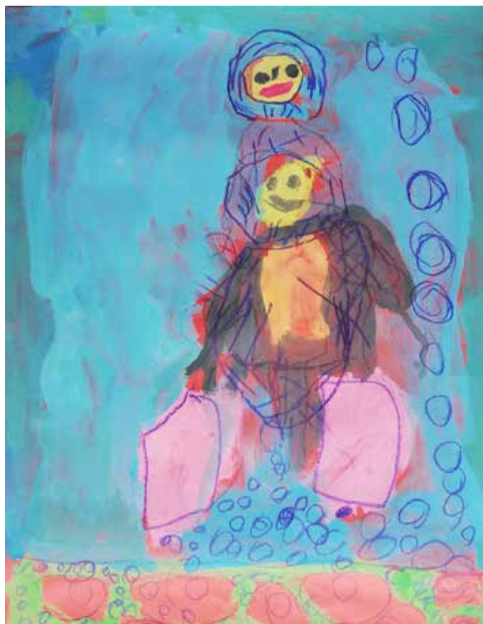
Nežino likovno delo je bilo do maja 2018 razstavljeno v Izobraževalnem centru za zaščito in reševanje na Igu

Centra Janeza Levca Ljubljana v področnem sklopu Igraj se z mano in Spoznaj svet je bilo njeno likovno delo »Pikapolonice, moje prijateljice« pohvaljeno in izbrano za razstavo, ki je gostovala tudi v Koroški galeriji likovnih umetnosti Slovenj Gradec.