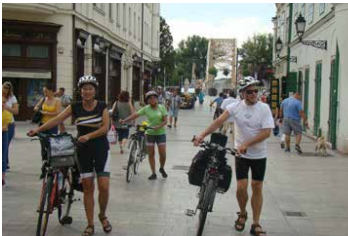
Madžarsko mesto Győr

nim občutkom, saj si nekako dvignjen nad reko, sčasoma pa postane dolgočasno zaradi enoličnosti pokrajine. Na Donavi so tudi elektrarne, rečni promet pa je omogočen z zapornicami s pretočnimi polji, v katerih ladje dvigajo na novo višino. Ogledali smo si, kako izvedejo dvig rečne ladje. Zvečer smo prispeli v madžarsko mesto Győr.