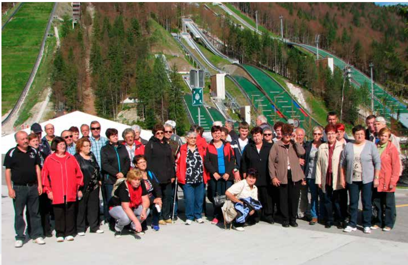
Člani OO društva invalidov Ribnica - Josipdol

Občinski odbor društva invalidov Ribnica – Josipdol za 50-letno delovanje na področju društvene in humanitarne dejavnosti prejme Priznanje Občine Ribnica na Pohorju.