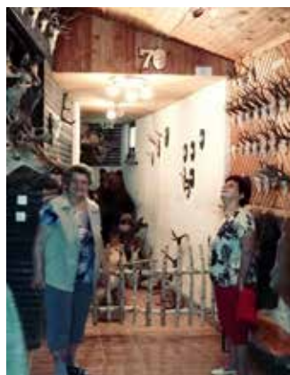
Predsednica in podpredsednica društva v lovski koči