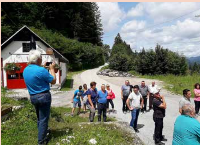
Srečanje članov KUD-a, 9. 6. 2018

ga zbora v maju povabljeni kot gostje na praznovanje 70. obletnice Moškega pevskega zbora Vuhred. V čast nam je bilo, da smo lahko nastopili na njihovi obletnici in tako navezali stike tudi z njihovimi pevci.