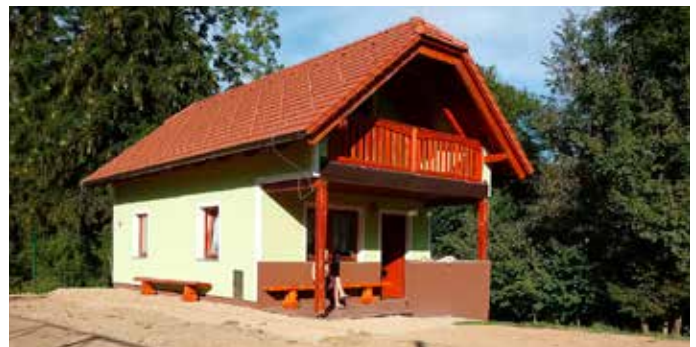
Sanacija vaškega doma in namestitev strelovodov - september 2018