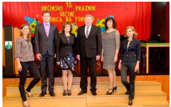
Občinska uprava in župan Srečko Geč