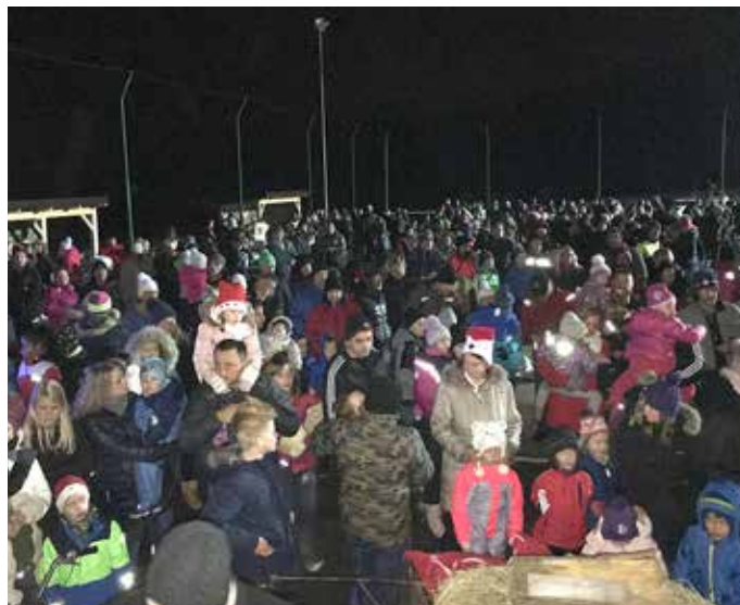
Prihod božička je pričakalo 150 otrok s svojimi starši

V jesenskih mesecih smo organizirali strokovno ekscuzijo na Gorenjsko. V prekrasni dolini pod Poncami smo si ogledali Nordijski center Planica. Nekaj udeležencev se nas je opogumilo za prelet planinške velikanke po ziplitinu. Adrenalinski spust je dolg kar 566 metrov in bilo je naravnost fantastično. Nadalje nas je pot vodila v Begunje, kjer smo si ogledali Muzej Avsenik in Alpski smučarski muzej Elan.