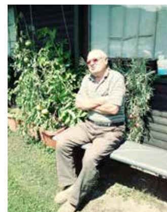
Starosta Klančnikove kmetije