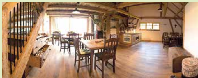
Notranjost apartmaja za 10 oseb

No, in še ena novost, ki jo pričakujemo v kratkem. Seveda spet elektrika – električna kolesa, e-bike. Projekt, ki smo ga preteklo zimo