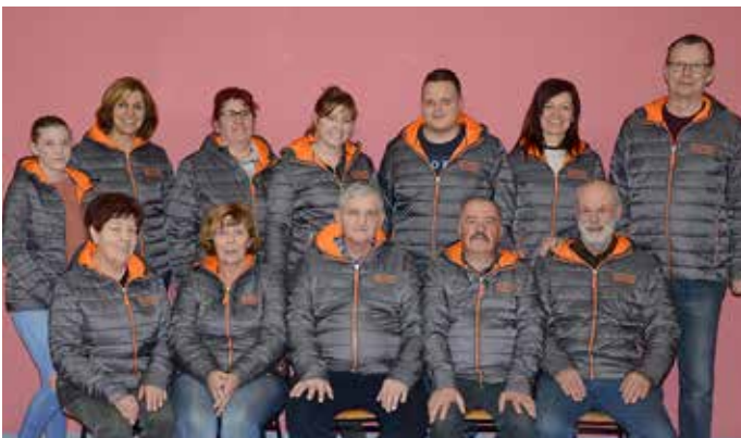
Člani dramske sekcije KUD Stane Sever