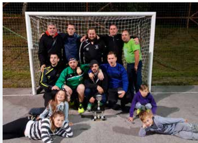
Članska ekipa Hudega Kota je zasedla 3. mesto v medobčinski ligi malega nogometa skupine B

Pred pričetkom letnih dopustov smo izpeljali že 25. Voduškov memorial, katerega se je letos udeležilo 12 ekip. Pri tem se ne morem izogniti dejstvu, da je turnir v Hudem Kotu znan daleč naokrog, predvsem po dobri organizaciji, poštenosti in odličnem ambientu, saj na ta turnir vsako leto prihajajo ekipe od Velenja pa vse do Ptuja.