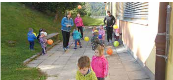
Odbijanje balonov v zrak

V naši skupini izvajamo najrazličnejše dejavnosti na vseh področjih, ki jih določa kurikulum za vrtece. Tako smo v petek, 5. oktobra 2018, izvedli MALČKOV ŠPORTNI DAN (orientacijski pohod) najmlajših v vrtcu. Otroci so morali biti zelo dobri opazovalci, hkrati pa so navdušeno premagovali številne aktivnosti po postajah, označenih z baloni. Na cilju jih je čakalo presenečenje – iskanje skritega zaklada. Bravo, našli smo ga! Sledili sta pogostitev in osvežitev s sokom iz gozdnih sadežev. Preživeli smo čudovit, razigran, sončen in gibanja poln jesenski dopoldan.