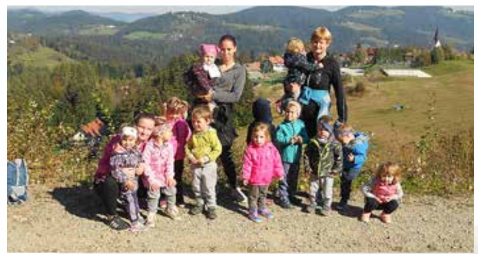
Zaključek Malčkovega športa