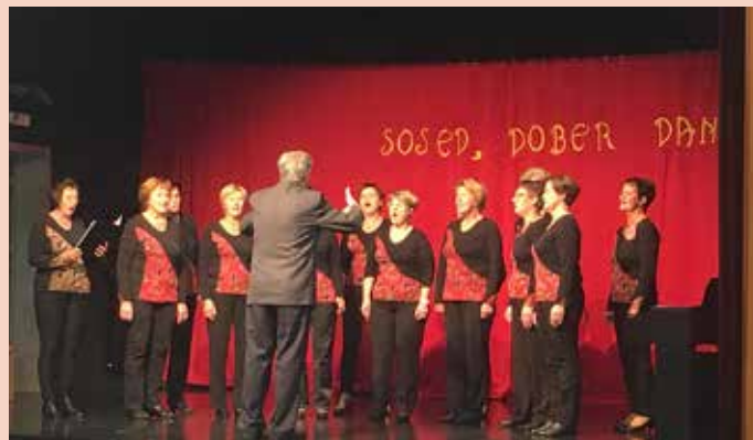
Nastop Ženskega pevskega zbora Mislinja na srečanju Sosed dober dan, 27. 10. 2018

jev naše občine, torej: Ženski zbor Mislinja, Moški zbor Vuhred in Mešani zbor sv. Anton na Pohorju. Tako smo s petjem in druženjem pokazali in dokazali, da se lahko tudi na tak način povezujemo in promoviramo Ribnico in turizem v naši bližnji okolici.