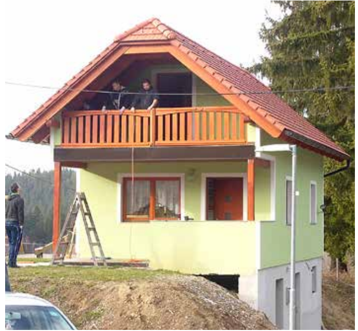
Večnamenski prostor v Hudem Kotu ima uporabno dovoljenje

Ena najvažnejših dejavnosti občine je pomoč pri delovanju društev, saj so v ruralnem okolju edini, ki vzpodbujajo, usmerjajo in izvajajo športne, kulturne, humanitarne in sploh družbene dejavnosti. Zato bomo še naprej podpirali njihovo delovanje. Posebno omembo med društvi zasluži seveda Prostovoljno gasilsko društvo Ribnica-Josipdol. Ob vsaki priložnosti se prepričam o njegovi vrednosti in seveda s ponosom pohvalim to naše društvo. Pomagati sočloveku v primerih, ki jih doživljajo naši gasilci, je največ, kar lahko človek prispeva v neki družbi. In naši gasilci so to nesebičnost že večkrat dokazali.