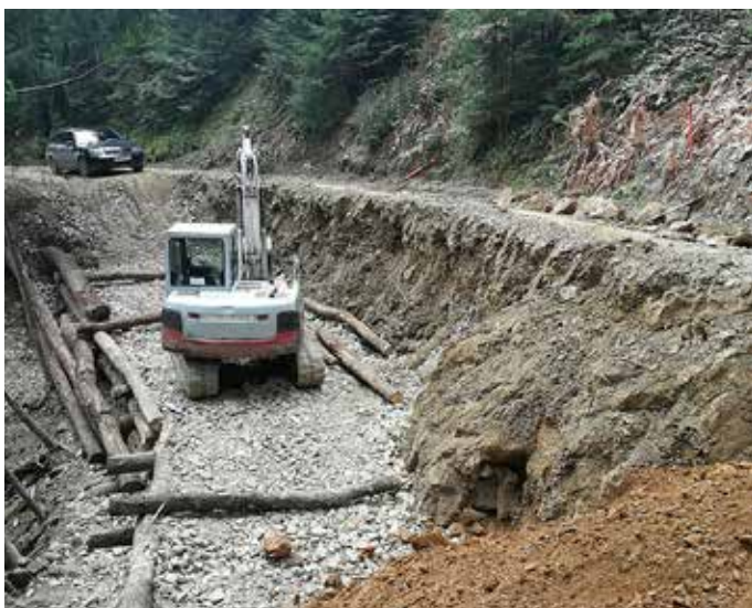
Zahtevna obnova ovinka na gozdni cesti

Največja postavka v porabi v proračunu 2018 je seveda izobraževanje. Kar dobrih 270.000 evrov smo namenili vrtcu in Osnovni šoli Ribnica na Pohorju ter Glasbeni šoli Radlje ob Dravi.